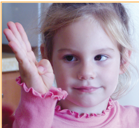
Dijete uči brojiti

Djetinjstvo započinje rođenjem djeteta. To je razdoblje tjelesnog i umnog razvoja. Dijete usvaja različite vještine (hodanje, govorenje) i uči (čitanje, pisanje). Tim će se vještinama i znanjima koristiti cijeli život.