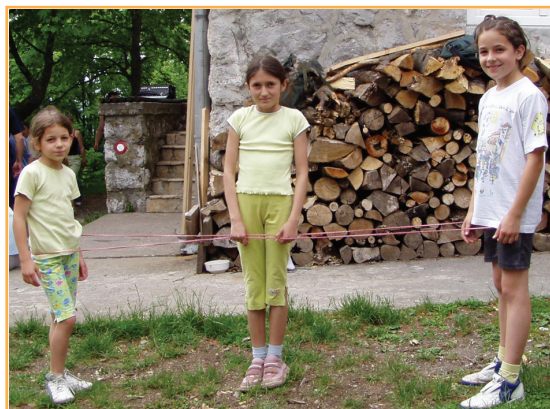
Djeca u igri

Promatranjem okoline, oponašanjem članova obitelji, igrom, učenjem u školi, dijete razvija svoje umne sposobnosti. Druženje s vršnjacima (u vrtiću, školi) od izuzetne je važnosti, jer omogućuje djetetu da pronađe svoje mjesto u zajednici i djeluje kao njen ravnopravni član.