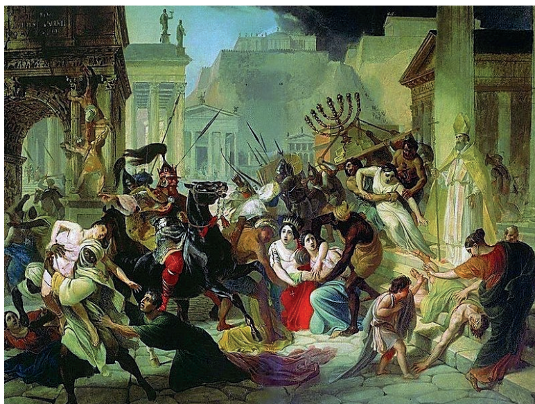
Karl Briullov (Bruilov): Vandali napadaju Rim

Vandali su tako jako razrušili Rim da se u danas po njima zovu ljudi koji razbijaju i uništavaju.