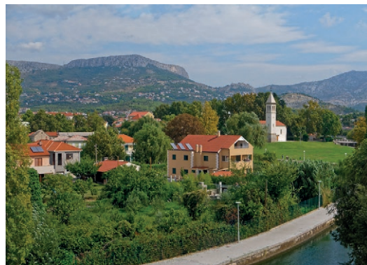
u blizini Salone razvio se grad Solin