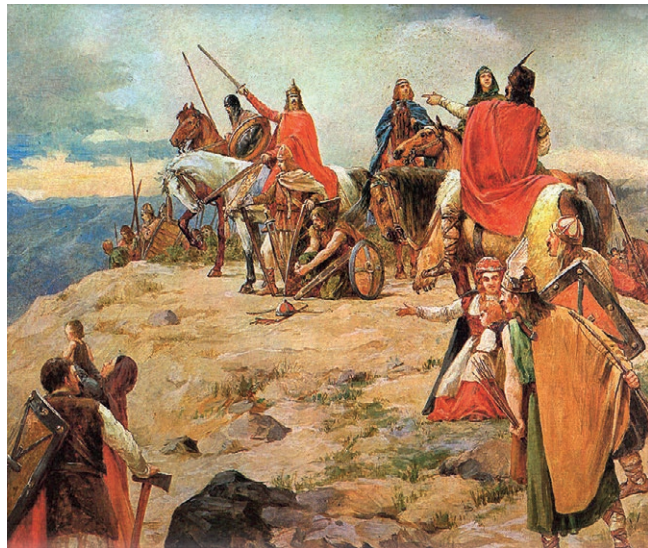
Oton Iveković: Dolazak Hrvata na Jadran

O dolasku Hrvata i hrvatskoj povijesti do 9. stoljeća znamo jako malo. Nedostaju povijesni izvori. Bizantski car Konstantin VII. (Sedmi) Porfirogenet u svojoj knjizi spominje Hrvate. Piše da su Hrvati došli u današnju domovinu krajem 6. i početkom 7. stoljeća. Doselili su se sa Sjevera.