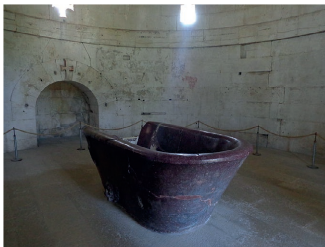
grobnica kralja istočnih Gota u Ravenni u Italiji

Vandali su naselili područje na zapadu Sjeverne Afrike.