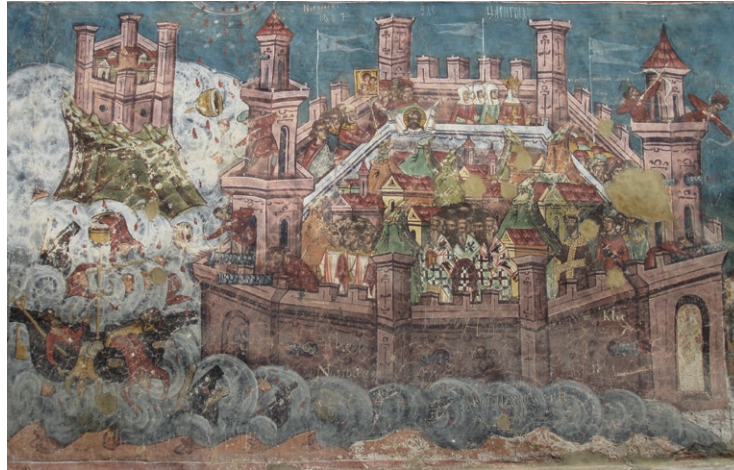
Opsada Konstantinopola 626. godine, slika na zidu manastira u Rumunjskoj

Avari su dio Slavena pokorili, a s ostalima su sklopili savez. Avari i Slaveni sve su češće napadali Istočno Rimsko Carstvo (Bizant). Početkom 7. stoljeća okružili su grad Konstantinopol. Nisu ga uspjeli zauzeti. Bizantski car dopustio je Slavenima da se nasele na tlu Bizanta. Slaveni su počeli stvarati svoje države.