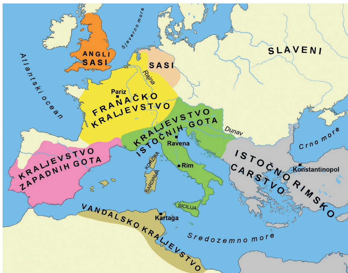
Europa početkom 6. stoljeća

Najvažnije države stvorili su Franci, Zapadni i Istočni Goti te Vandali.