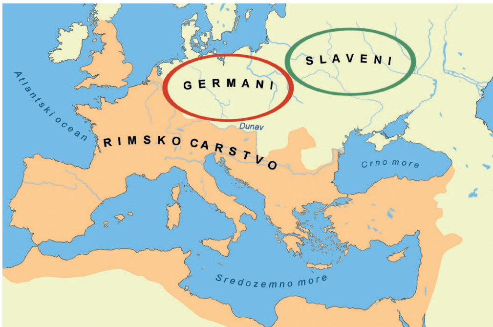
Područja Germana i Slavena

Potkraj 4. stoljeća u Europu su došli Huni .