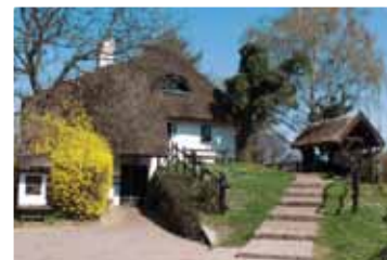
podravska klet, Starigrad pokraj Koprivnice

Sela u Slavoniji smještena su uz glavnu prometnicu s kućama s jedne i druge strane. Takva naselja zovemo ušorena ili nizna naselja.