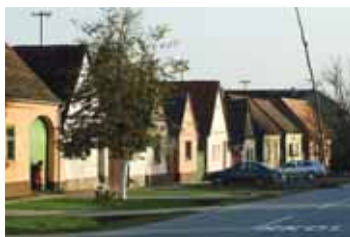
Novi Perkovci, Osječko-baranjska županija

Kleti su tradicionalne kućice građene od drveta ili gline i pokrivene slamnatim krovom. Smještene su usred vinograda u brežuljkastim predjelima Hrvatske.