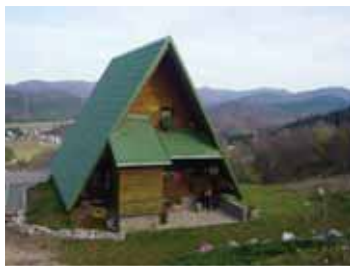
Brestova Draga, Gorski kotar

U gorskim predjelima arhitektura je prilagođena oštrijoj klimi s dugim i snježnim zimama. Zato su krovovi kuća strmi. Tradicionalne kuće građene su od drveta kojeg u gorskim predjelima ima u izobilju.